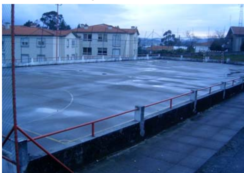
“Complexo desportivo da Palmeira”

Sobre as habitações sociais da Palmeira, também aqui descobrimos o insólito! As 18 habitações, inauguradas com toda a pompa e circunstância, para além de não terem qualquer tipo de parque para os mais novos brincarem, em certas alturas do ano também não tem... água! É verdade! Seria de imaginar que este tipo de habitação estaria ligado à rede de abastecimento de água, mas não. Acontece que a água que serve estas habitações provém de um furo, furo esse que no Verão seca, obrigando os seus habitantes a pedir “emprestados” baldes de água aos vizinhos.